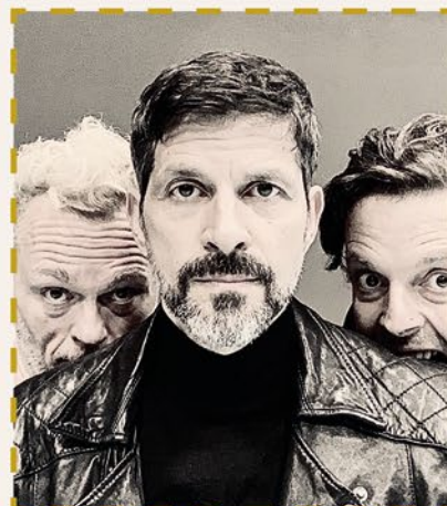
22.01.2026 - Pasquale Aleardi & die Phonauten Zusatzshow / Konzert (23.01. ist ausverkauft)