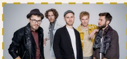
20.03.2026 - anders Acapella Konzert „So kurz davor“