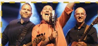
17.04.2026 - Die Mitsinger Mitsingkonzert