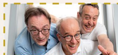
09.05.2026 - TBC Kabarett „Womerschomadasin“