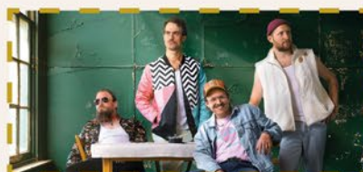
18.09.2026 - Gankino Circus Konzert „Das Gegenteil von Rock'n'Roll“