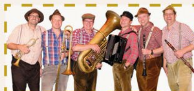
07.02.2026 - Häisd'n'däisd vomm mee Musikkabarett