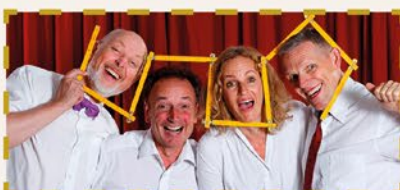
31.01.2026 - Beutelboxer Improtheater