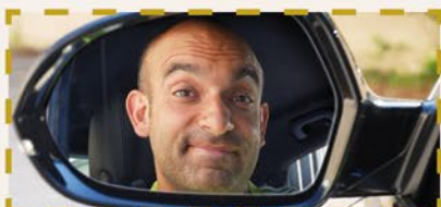
18.01.2026 - Django Asül Kabarett Jahresrückblick „Rückspiegel 2025“