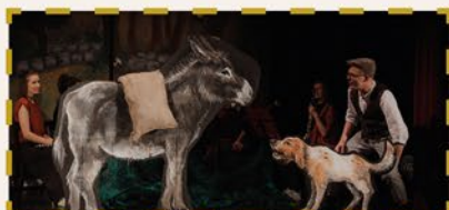
01.02.2026 - Maruti Quintett Kindermärchenkonzert „Die Bremer Stadtmusikanten“