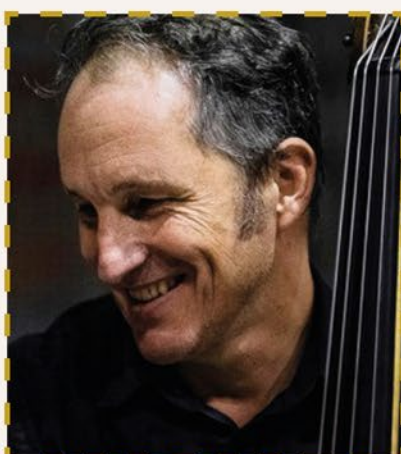
26.09.2025 - Blue Friday Jazzlounge Jazz - „Inside Colours“