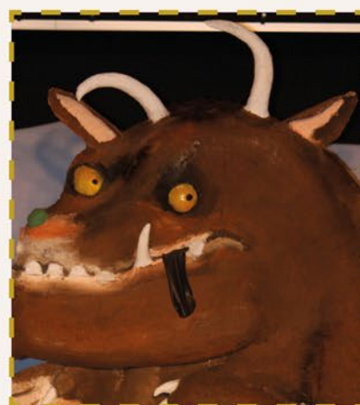
28.09.2025 - Der Gruffelo Kindertheater - Pohybs und konsorten