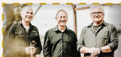
27.09.2025 - Black Velvet Band Konzert - Irish Folk