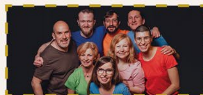
18.10.2025 - „10 vor 8“ Improtheater