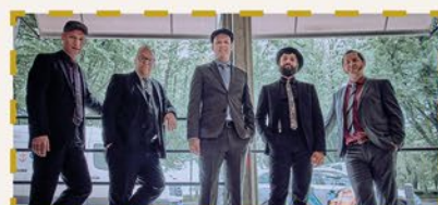
19.10.2025 - South West Oldtime All Stars Konzert - „100 Jahre Louis Armstrongs Hot5“

Tickets unter: www.kulturscheune-hoechberg.de oder in der Bibliothek Markt Höchberg kulturscheune höchberg, Wallweg 3, 97204 Höchberg