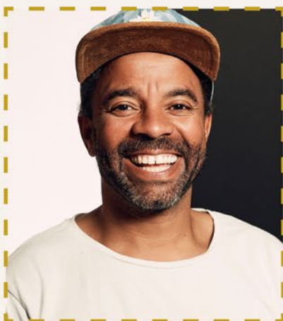
24.10.2025 - Simon Pearce Stand Up Comedy - „Hybrid“