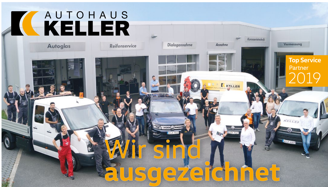
Die Mitarbeiter des Keller-Team vor dem Karosserie- und Reifenzentrum in Veitshöchheim.